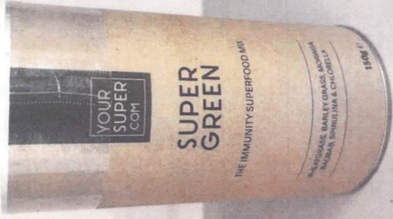
Anlage K 1